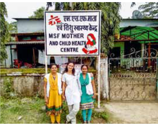
INDIEN: Parnian Parvanta © MSF