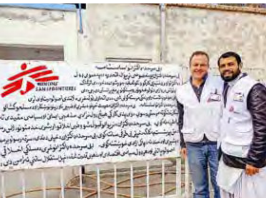
AFGHANISTAN: Klaus Konstantin © MSF