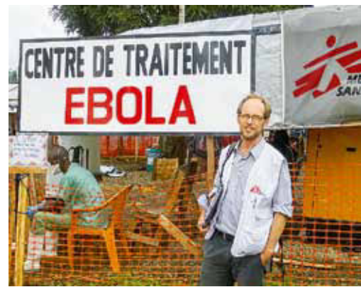
GUINEA: Maximilian Gertler © MSF