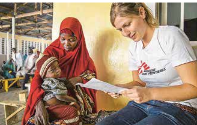
NIGERIA: Fiona Bay