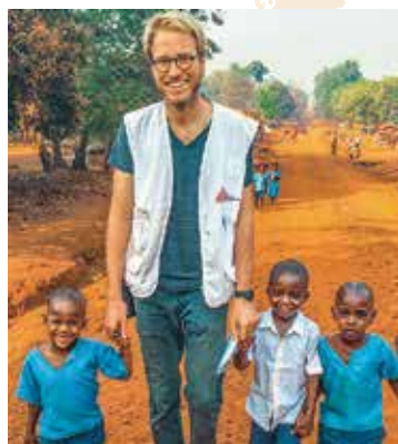
ZENTRALAFRIKANISCHE REPUBLIK: Felix Machleidt © MSF