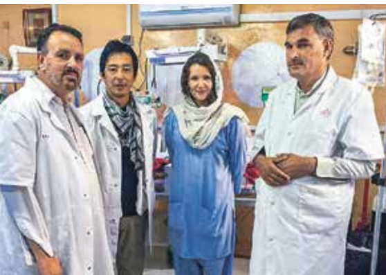
AFGHANISTAN: Franziska Noll © MSF