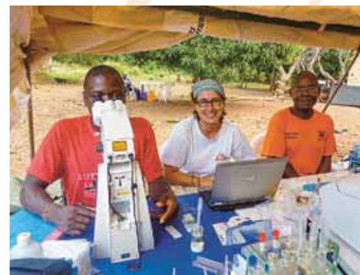
DEMOKRATISCHE REPUBLIK KONGO: Simone Vollmer © MSF