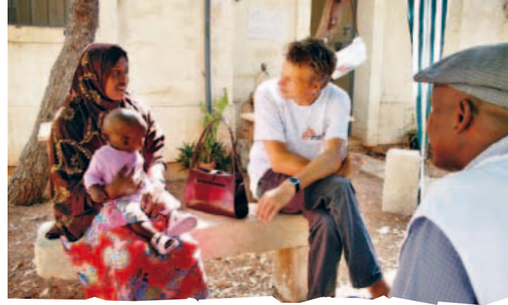
Das Bild entstand bei einer Therapiesitzung mit ÄRZTE OHNE GRENZEN . Die Flüchtlinge malten ihre Erlebnisse und Gefühle während der Flucht über das Mittelmeer.