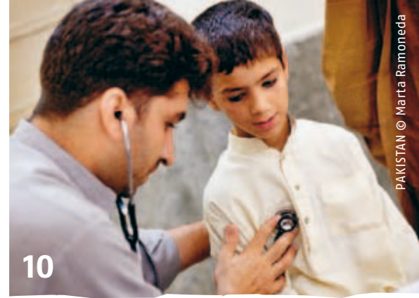
PAKISTAN © Marta Ramoneda