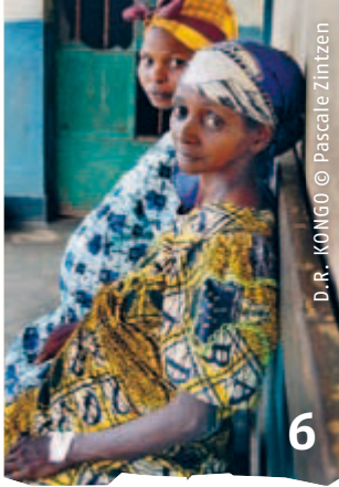
D.R. - KONGO © Pascale Zintzen