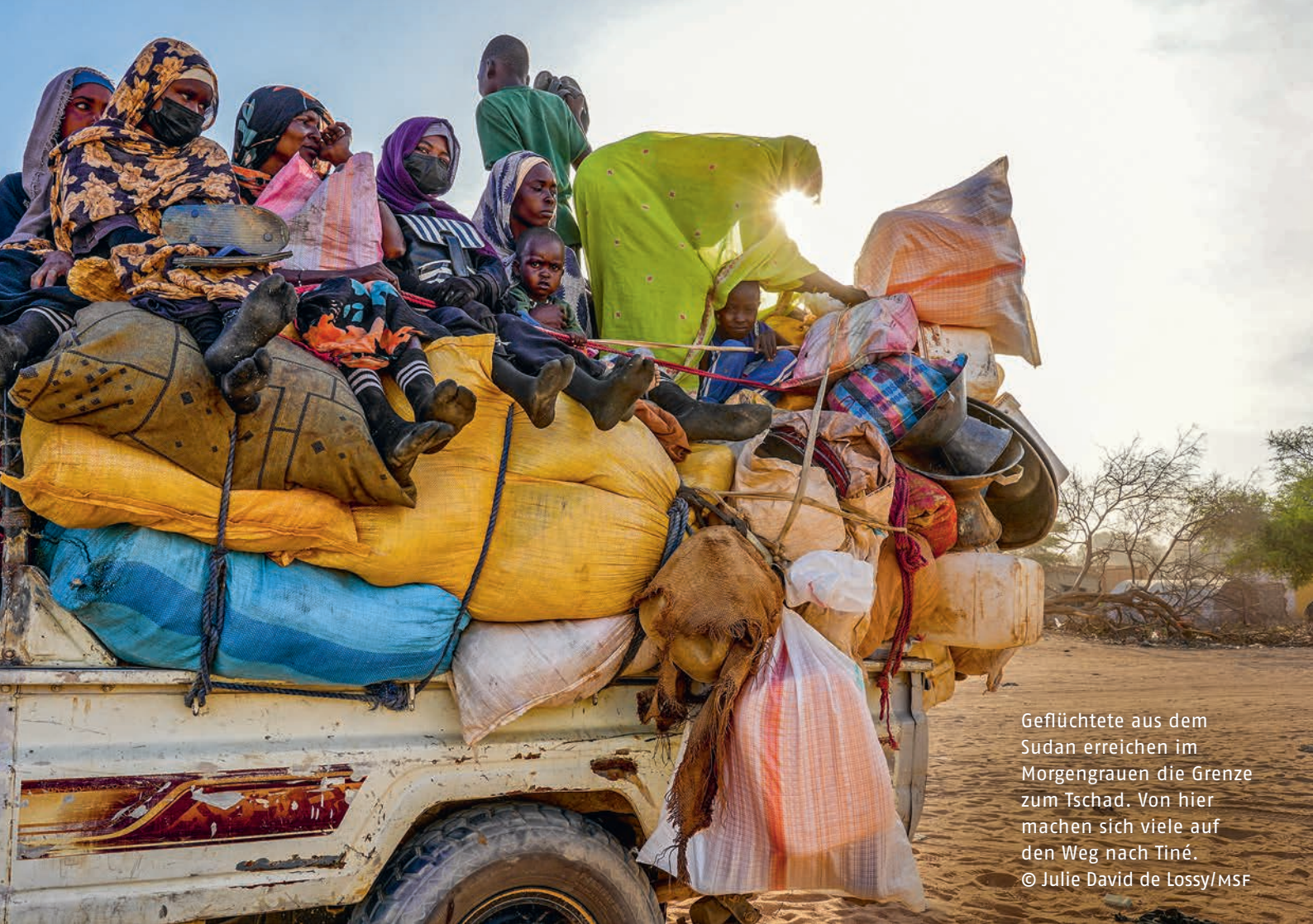
Geflüchtete aus dem Sudan erreichen im Morgengrauen die Grenze zum Tschad. Von hier machen sich viele auf den Weg nach Tiné.