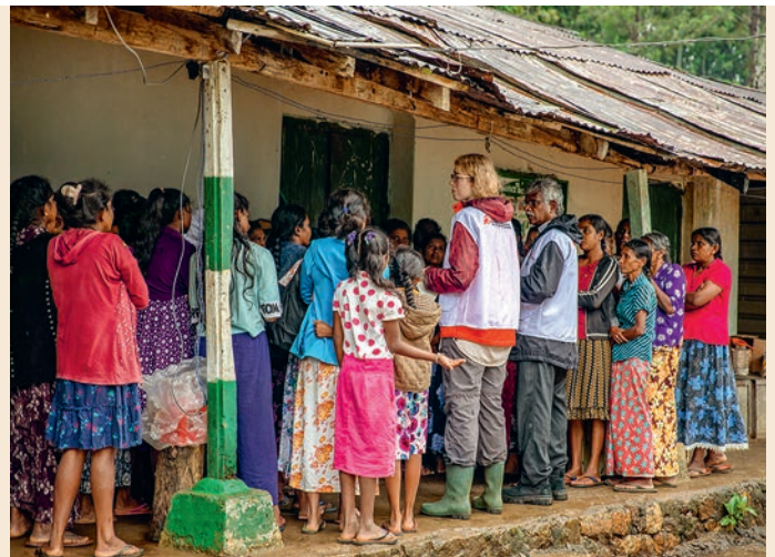
Unsere Mitarbeitenden sprechen mit den Menschen in einer Notunterkunft in der Provinz Uva, um die Wasser- und Sanitärmaßnahmen nach ihren Bedürfnissen auszurichten.