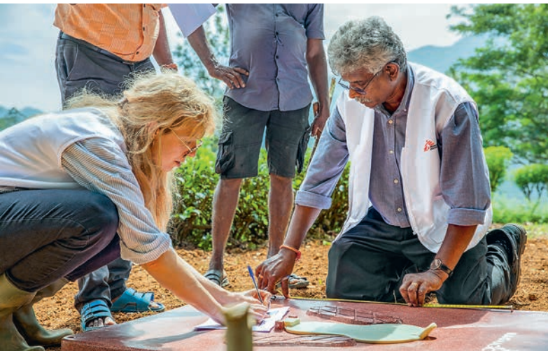
Unsere Wasser- und Sanitätsexpertin und unser Logistiker markieren Standorte für den Bau von Latrinen und Duschen.