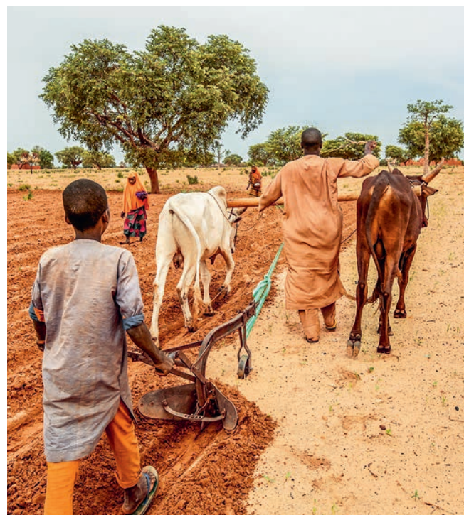
Landwirte bestellen ihre Felder im Bundesstaat Katsina. Ernten sind in der Region immer wieder von Dürren bedroht.

Es war ein wichtiger Therapieerfolg, doch wir hatten ein höheres Ziel: Der Junge sollte zum ersten Mal in seinem Leben selbstständig laufen. Dafür arbeiteten wir an seiner Beckenrotation. Ich stellte zwei kleine