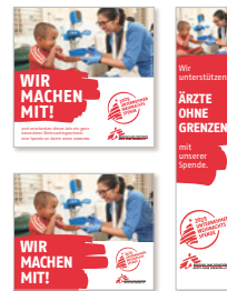
Social-Media-Visuals, Banner, E-Mail-Signaturen