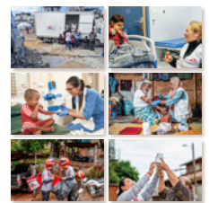
Fotos und Informationen zu ausgewählten Projekten

Hinweis: Viele Materialien liegen auch in einer englischen Sprachversion vor.