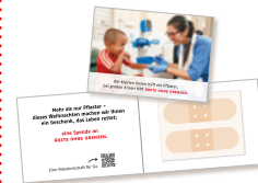
Pflastermappchen für Ihre Weihnachtspost