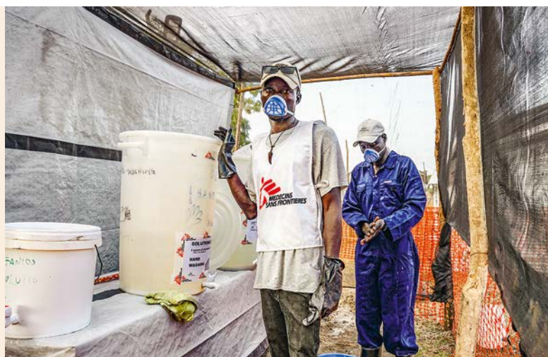
In unserem Cholera-Behandlungszentrum in Malakal versetzen Mitarbeitende Wasser mit Chlor und machen es dadurch keimfrei.

Im vergangenen Oktober ist im Südsudan Cholera ausgebrochen. Erschreckend schnell hat sich die lebensbedrohliche Durchfallerkrankung im gesamten Land ausgebreitet. Allein bis Ende Januar waren mehr als 22.000 Menschen erkrankt. Das südsudanesisches Gesundheitssystem ist ohnehin stark überlastet. Wir haben sofort reagiert und mehrere Cholera-Behandlungszentren mit insgesamt 388 Betten errichtet. Um die Epidemie einzudämmen, impften wir rund 200.000 Personen. Zudem verbessern wir die Wasser- und Sanitärsituation und informieren die Menschen, wie sie sich vor Cholera schützen können.