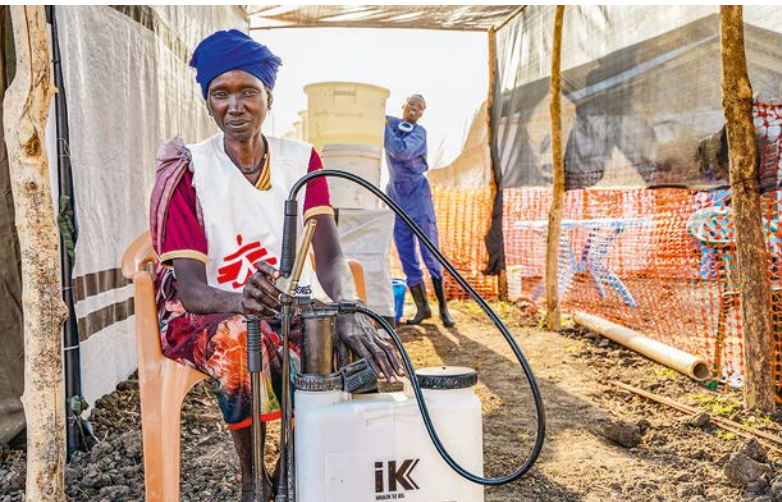
Unsere Mitarbeiterin besprüht die Schuhe der Menschen, die unser Behandlungszentrum betreten oder verlassen, mit chloriertem Wasser. Dies hilft, die Ausbreitung der Cholera-Erreger zu verhindern.

Die Ankündigung der Taliban, Frauen vom Studium an medizinischen Instituten auszuschließen, wird schlimme Folgen für die Gesundheitsversorgung im Land haben. Das Verbot verdrängt Frauen weiter aus dem öffentlichen und beruflichen Leben. Zugleich kann der enorme medizinische Bedarf in Afghanistan ohne die Ausbildung weiblichen Personals nicht gedeckt werden. Besonders für die Versorgung von Müttern sind Gynäkologinnen und Hebammen unerlässlich. In unseren sieben Hilfsprojekten im Land sind die Hälfte der Gesundheitsmitarbeitenden Frauen.