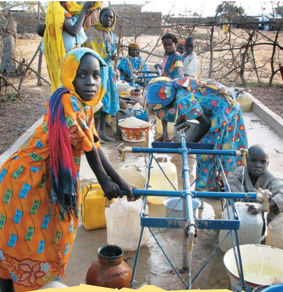
Logistiker von ÄRZTE OHNE GRENZEN bauen Brunnen und sorgen so für sauberes Trinkwasser in Vertriebenenlagern. Tschad

Im Gespräch lässt sich vieles oft einfach und vertraulich klären. Einige Fragen, die mir häufig gestellt werden, beantworte ich schon an dieser Stelle.