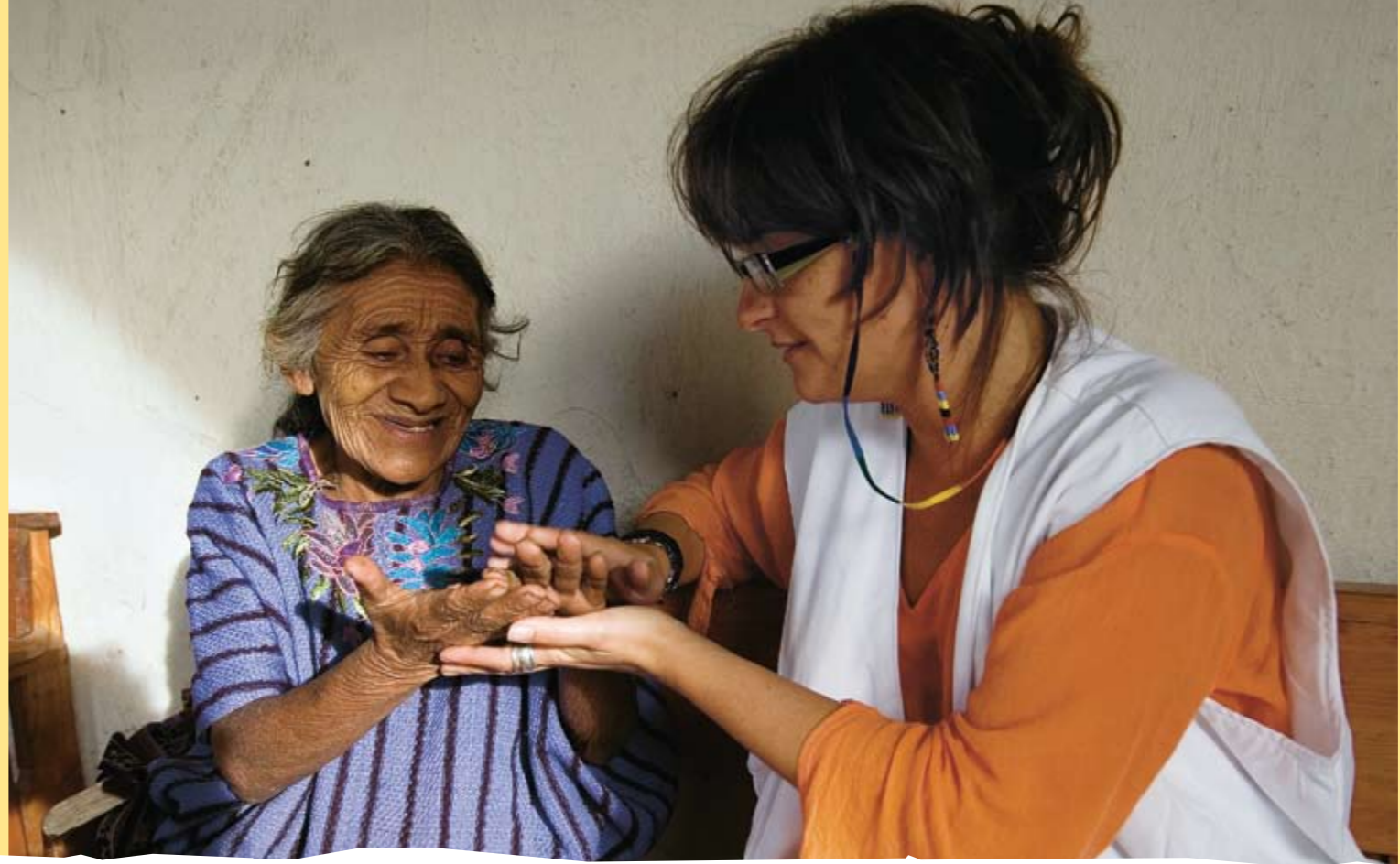
Die Überlebenden von Naturkatastrophen oder gewaltsamen Konflikten brauchen häufig psychologische Hilfe. Guatemala