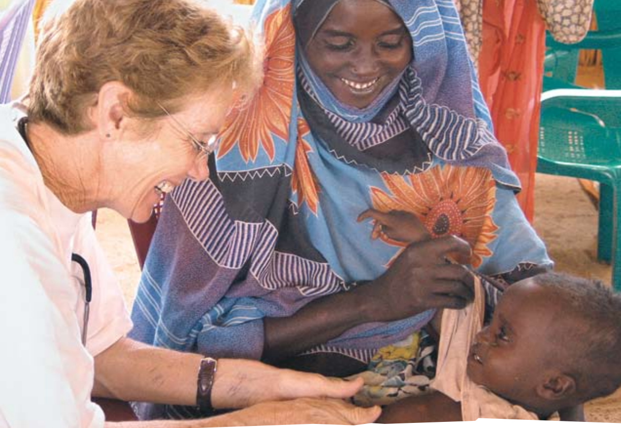
Frauen sind meist für die Gesundheit ihrer Kinder verantwortlich und deshalb besonders auf medizinische Hilfe angewiesen. Sudan/Darfur