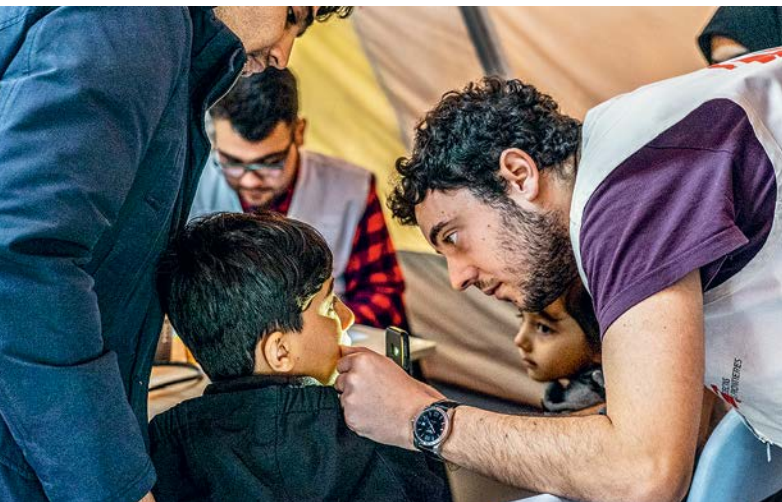
In unserer Klinik behandelt unser Team täglich bis zu hundert kranke Kinder.

Bei einem Luftangriff in Mocha wurde ein von ÄRZTE OHNE GRENZEN betriebenes Krankenhaus teilweise zerstört. Zur Zeit des Angriffs im November 2019 waren 30 Patient*innen und 35 Mediziner*innen in dem Gebäude. Glücklicherweise konnten alle rechtzeitig in Sicherheit gebracht werden. Wir mussten den Betrieb vorübergehend einstellen. Patient*innen in Lebensgefahr hat unser Team in ein anderes Krankenhaus in der Stadt verlegt. Wir hatten den Standort unserer Klinik zuvor allen Kriegsparteien und Behörden mitgeteilt. Es ist die einzige Klinik in der Region, die kostenlos Hilfe anbietet.