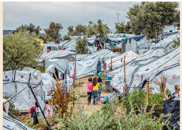
Die Lebensbedingungen im Flüchtlingscamp auf Lesbos machen die Menschen krank.